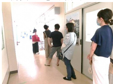
新しい生活様式での引き渡し訓練：手指消毒、ソーシャルディスタンス