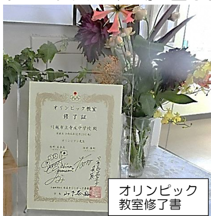
オリンピック教室修了書

場の2名の「オリンピック」を迎え、各クラス「運動」1時間、「座学」1時間の中でオリンピック大会出場に至るまで、また、オリンピック大会に出場して得た貴重な体験を通してオリンピックの価値を伝えていただきました。