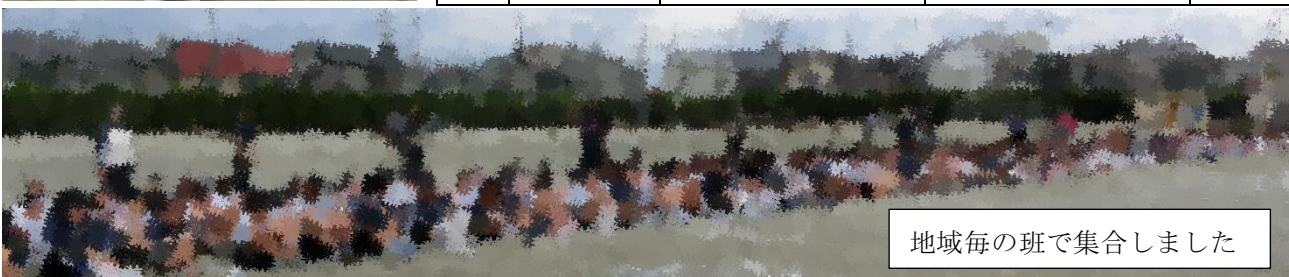
地域毎の班で集合しました