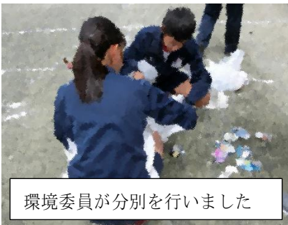
環境委員が分別を行いました

前日にメール配信を行い、実施時間帯の見守りのお願いをしました。ご協力ありがとうございました。