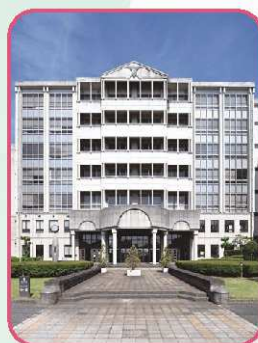
川越市立川越高等学校