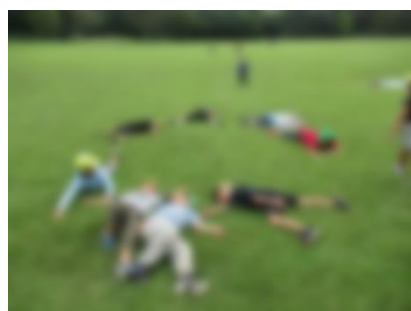
2年校外学習(10/5) 森林公園に行ってきました。