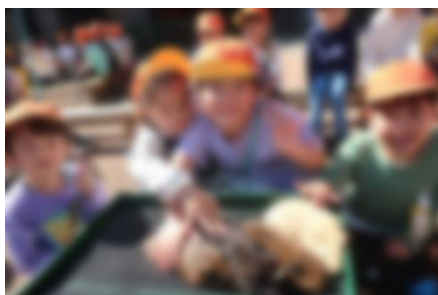
1年校外学習(10/28) 高坂こども動物公園に行ってきました。