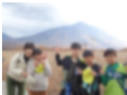
6年修学旅行(10/25・26) 日光の歴史や自然に触れ、仲間と共に楽しく行ってきました!

※10日は、市内職員全員の研修会のため、児童は13時下校となります。※28日は、研究発表会のため、学年により下校時刻が異なります。