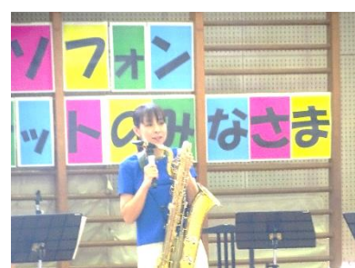
子どもの文化芸術体験(10/3) 楽しくプロの演奏を聴きました。