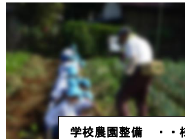
学校農園整備・・・様