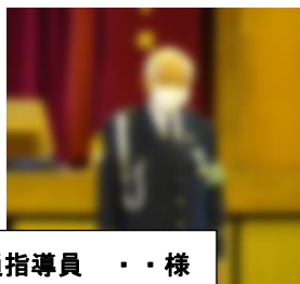
交通指導員・・・様

世の中はお互いに支え、また支えられて成り立ちます。多くの人のおかげで自分が存在していると気づくと、自然と感謝の気持ちが湧いてきます。この感謝の気持ちが、また子ども達の育ちを大きくしていくと考えます。学校は、子ども達一人一人に、自分を支えてくれている方々の存在への気づきと感謝の気持ちが持てるよう、働きかけていきたいと思えます。