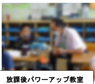
放課後パワーアップ教室