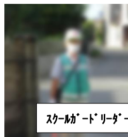
スクールリーダー・・・様