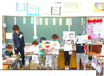
1年 学級会(研究授業)