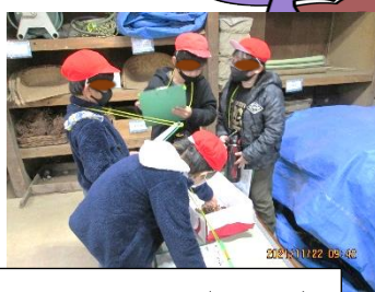
3年 校外学習(今昔村)