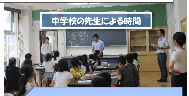
中学校の先生による時間

手羽先を使って、体の動くしくみを勉強しました。本物の手羽先を自分たちで動かしたので、よくわかりました。とても楽しかったです。