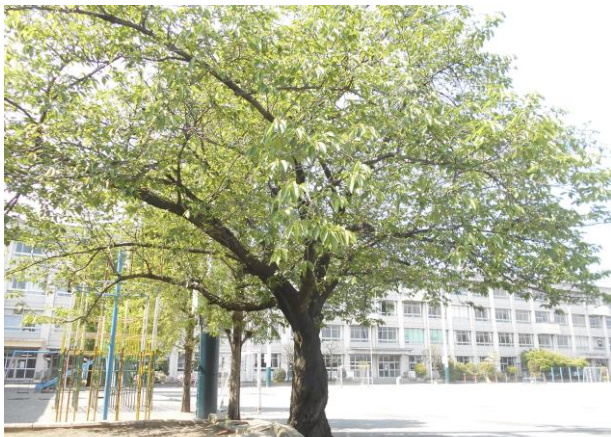
(さくらの木は き みどりの は 葉がいっぱい)

コロナウイルス かんせんしょう 感染症が ひろ 広がるのを よぼう 予防するために、 がっこう 学校のお休みが やす さらにのびてしまいました。先生たちは、みなさんと あ 会うことができず、とても ざん ねんです。学校の がっこう 教室は、みなさんが、いつでも がっこうせいかつ 学校生活を はじ 始められるように先生たちが せんせい じゅんぴを ま しています。校庭は、 こうてい 緑が みどり いっぱいになり、みなさんが げんき 元気に あそ 遊んでくれるのを ま 待っているようです。そんな がっこう 学校の こうてい 校庭の様子を ようす 少し すこ しょうかいします。 み 見つらいかもしれませんが、 たの つたわると うれ うれしいです。