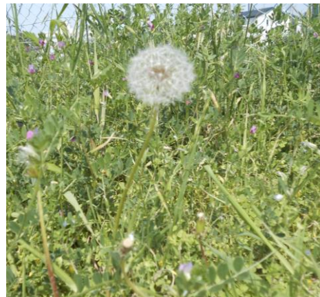
(たんぽぽは げ わた毛をとばしています。)