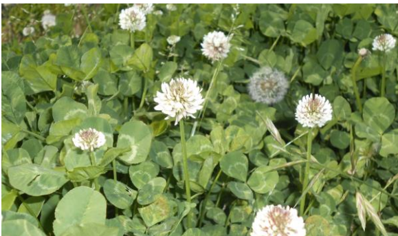
(シロツメクサも たく たくさん さい さいています。)