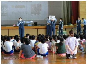
【指導員の方からのレクチャー】

9月22日(金)に3～6年生を対象に交通安全教室が行われました。交通安全指導員の方々による自転車に乗る際の交通マナーや交通事故は誰でも被害者や加害者になりうることをご指導いただきました。子どもたちは真剣に聞き入り、交通安全と命の