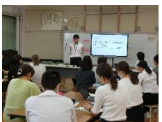
【研究授業・協議の様子】

2学期に入り、川越市教育委員会及び川越市教育研究会の委嘱を受けて取り組んでいる学校課題研究の校内授業研究会を実施しております。9月～11月にかけて、川越市教育委員会より指導者を招聘し、研究授業・研究協議会を行い、研修を深めています。