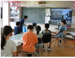
【オンライン会議の様子】

9月15日(金)に、新しい試みとして、本校の児童会(運営代表委員会)の児童が、霞ヶ関東中学校の生徒会の生徒とオンラインで会議を行いました。