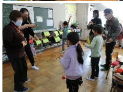
昔遊びで交流する様子