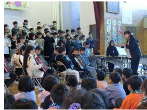
5年 合奏「名探偵コナンメインテーマ」 6年 合奏「新世界より 第4楽章」