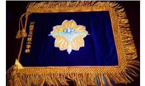
校旗が新しくなりました!

今年の夏も厳しい暑さが続きましたが、今は、夜風の涼しさと聞こえてくる虫の声に季節の移り変わりを感じられるようになってきました。