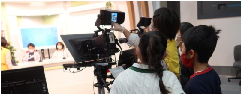
〈5年生 社会科見学〉スタンバイOK 321アクション!!