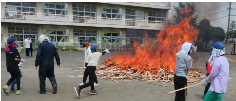
〈6年生 土器野焼き体験〉熱い熱い!! すごい火柱だ!!