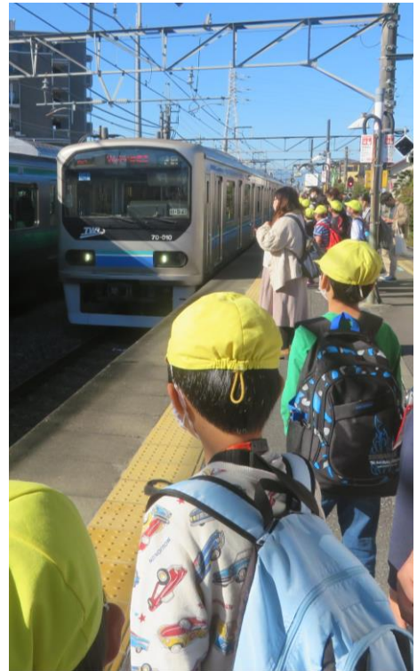
くすのき 校外学習 電車に乗って鉄道博物館に出発進行