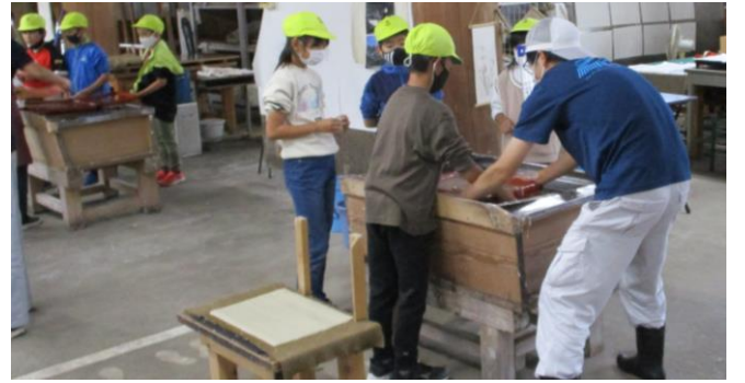
〈4年生 社会科見学〉きれいな和紙ができますように