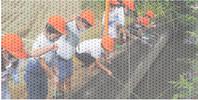
〈1年生 ザリガニつり〉見て!! あそこにいるよ!!