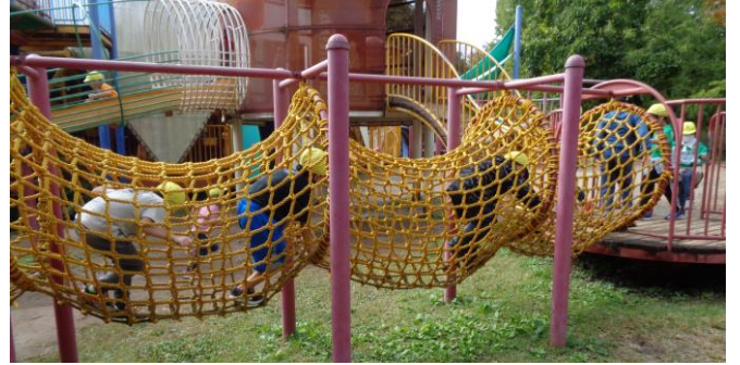
〈2年生 生活科見学(森林公園)〉やった〜 雨がやんだぞ