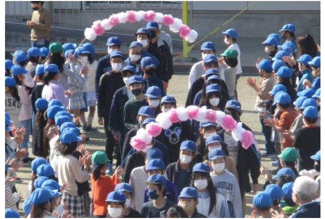
下級生に別れを告げる6年生 心温かくも寂しい時間