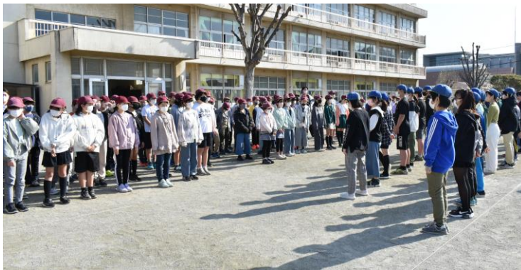
「6年生がんばれ〜！！」下級生からのエールが校庭に響く