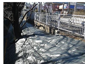
冬休み中に、職員で、北校舎裏の斜面に防草シートを敷きました。