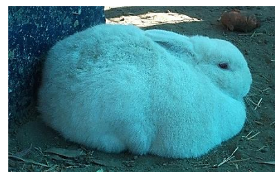
飼育委員会児童が世話をしているうさぎ

さて、今年の干支は癸卯(みずのとう)です。これまでの努力が花開き、実り始める年とも言われます。6年生116名にとって、小学校生活はあと3ヶ月、小学校での学びが実を結び、卒業の時を迎えます。ここで学ぶべきことを学び、新しい生活への準備を整えて、胸をはり、巣立ってほしいと願います。