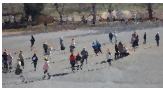
今年も休み時間に元気に遊ぶ子供たちの姿を見続けたいと思います

同様に、1～5年生にとっても、3学期は新学年への準備期間でもあります。「学校は勉強をするところ」ですから、その学年で学ぶべき学習内容が身につくよう、家庭学習の見届けを是非お願いいたします。