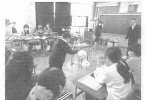
【野村証券金融教育6年生】 サイコロゲームで為替の勉強