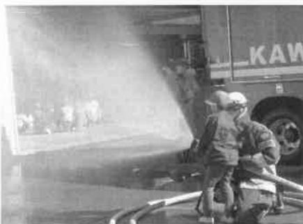
【消防署見学3年生】 迫力の消火体験ができました。