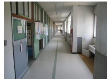
明るくなった廊下

今後とも教職員一丸となって理想とする学校づくりに全力で取り組んでまいります。保護者の皆様、地域の皆様、更なるご協力の程をよろしくお願いいたします。