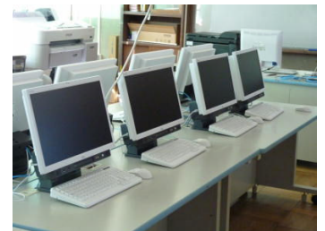
一新されたコンピュータ