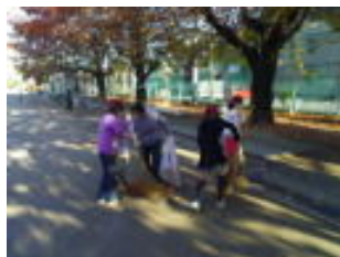
落ち葉掃きボランティア（児童）