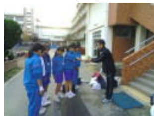
高階西中から大根をいただく