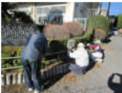
ボランティアさんによる生け垣作り

高階南小で検索すると、本校のHP（ホームページ）が出てきます。川越市の方針でホームページの表記が一部変わります。様々なページがありますが、特に「たかなんニュース」では、学校だよりに掲載し切れない子どもたちの活動の様子をご覧いただくことができます。