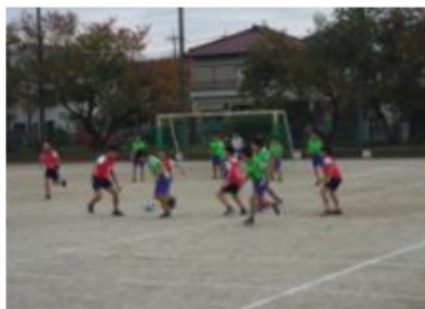
5年 サッカー大会(13日) 寺尾小学校と親善を深める