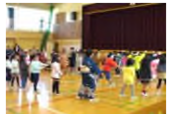
2年生おいもパーティー