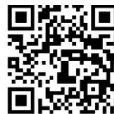
■ 証明書の取り方 ■ How to Obtain Certificate