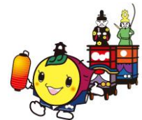
川越市マスコットキャラクターときも