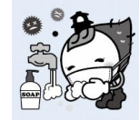
Linh vật của thành phố Kawagoe, TOKIMO