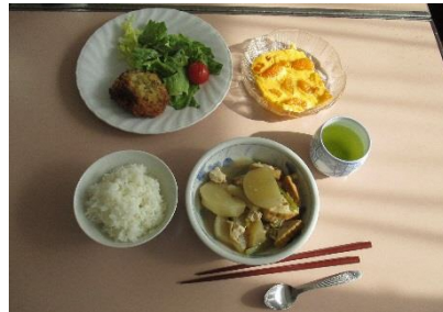
ごはん、メンチ風コロッケ、かぶと厚揚げの煮物、ヨーグルトミカンフラン