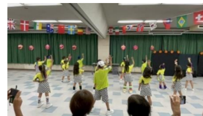
創作ダンス発表・ダンス体験