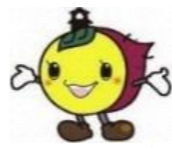
川越市マスコットキャラクターときも

霞ヶ関公民館 〒350-1175 川越市大字笠幡 177 番地 1 TEL : 049-231-1009 FAX : 049-239-1086 川越市公式 Twitter ユーザー名 : @Kawagoeshilnfo