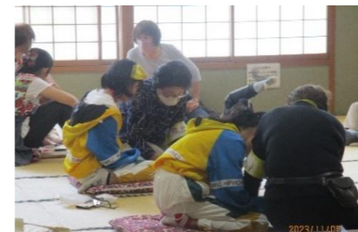
ミニ布ぞうり作り