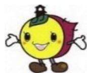
川越市マスコットキャラクターときも

霞ヶ関公民館 〒350-1175 川越市大字笠幡 177 番地 1 TEL : 049-231-1009 FAX : 049-239-1086 川越市公式 Twitter ユーザー名 : @KawagoeshilInfo