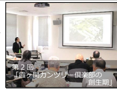
第2回 「霞ヶ関カンツリー倶楽部の 創生期」

3月1日(金)は「消えゆく古墳と古代の川越～山王塚古墳の意義と律令社会～」、8日(金)は「霞ヶ関カンツリーの創生期」をテーマにした2回シリーズ。延べ42人が参加しました。悠久なる時の流れ、先人の営みを学んだ2日間でした。