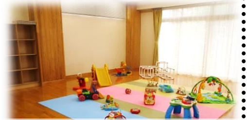
会場となるプレイルーム。 普段も無料開放しています。