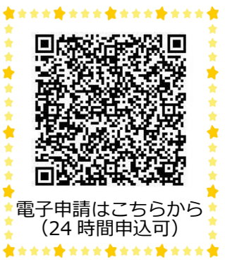
電子申請はこちらから (24時間申込可)

ファクスの場合は、①講座名「おもちゃの広場」、②子の氏名(ふりがな)、③子の月齢、④保護者氏名、⑤住所、⑥電話番号、⑦ファクス番号を明記し、当館へ送信。