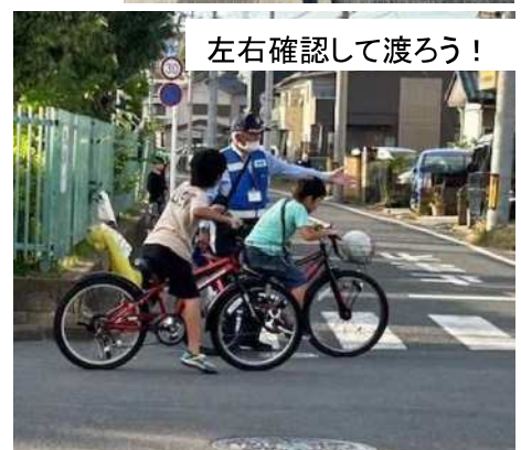
左右確認して渡ろう！