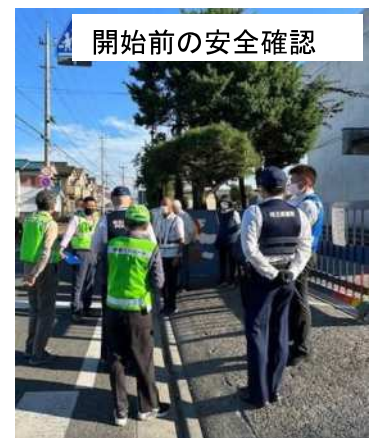
開始前の安全確認

実施日時 : 令和5年10月20日(金)14時30分から16時まで 参加者 : 川越警察署5名、市防犯・交通安全課2名、各校区自治会長、自治連高階支会長他 実施内容 : 各学校の校門及び下校道路の横断歩道及び交差点での交通整理及び見守り