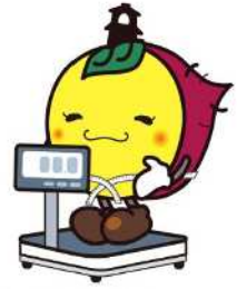
川越市マスコットキャラクター 埼玉県けんこう大使ときも