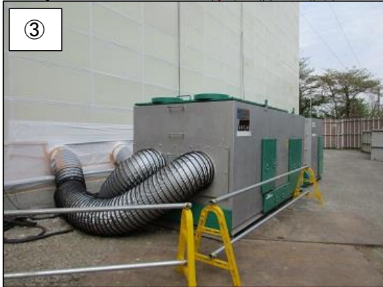
③ 負圧集塵機です。高性能フィルターを通してきれいな空気を排出します。