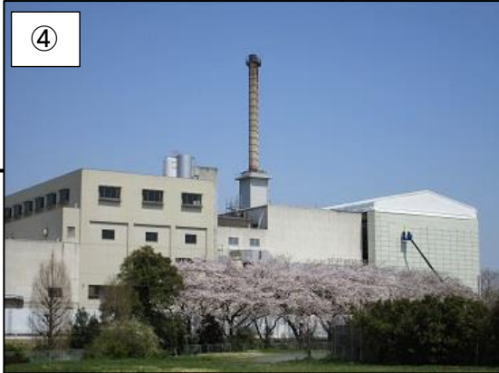
④ 仮設テント設置中の様子です。