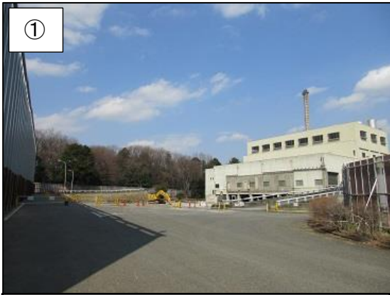
① 不燃物処理棟（地上部分）の解体が終わりました。