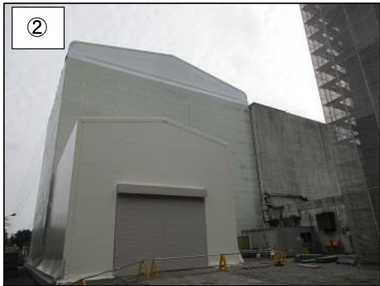
② 仮設テント設置完了後の様子です。この内部で機器の解体を行います。