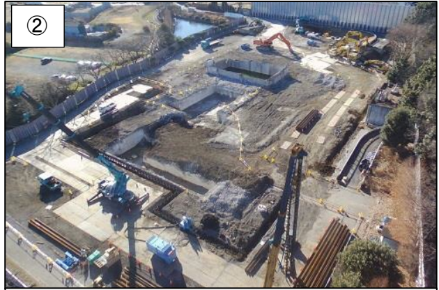
② 東側からの全景です。 (平成 29 年 12 月末)