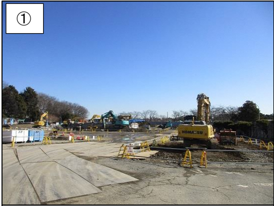
① 南西側からの全景です。

■ 地下構造物の解体を始めました。(平成 29 年 12 月～平成 30 年 2 月) 土留めを設置して、地下室や基礎の解体を始めました。 ※ 図中の番号・矢印は、写真番号と撮影方向を示しています。