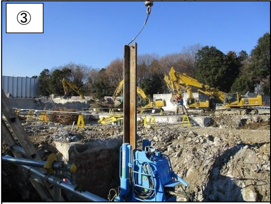
③ 鋼板製の土留めを設置している様子です。