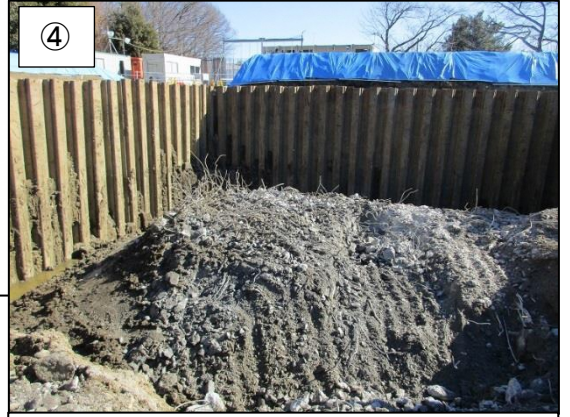
④ 土留めの内側で煙突基礎部分を解体している様子です。