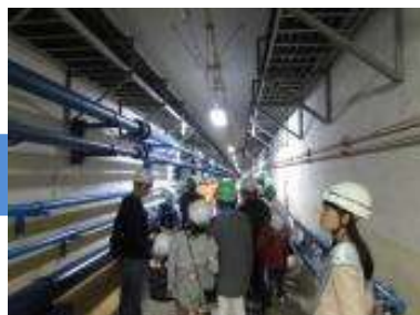
処理場の地下通路を見学