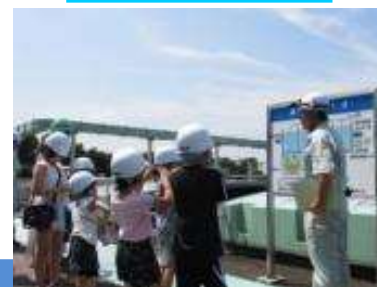
水処理の行程を見学

概要説明（約 30 分）→処理場内見学（約 40～50 分） ※ご希望によってスケジュール変更は可能です。 ※また、会議室等を使用して昼食をとることもできます。