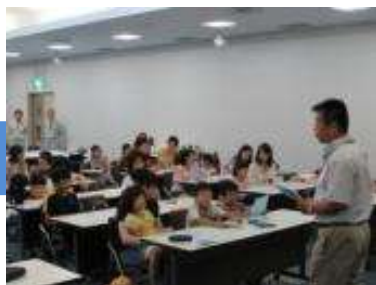
下水道の仕組みを解説