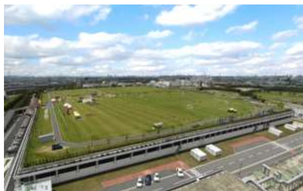
写真：中川水循環センターの上部公園 ※荒川水循環センター、新河岸川水循環センター、元荒川水循環センターにも上部公園があります。