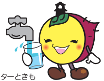
川越市マスコットキャラクターときも

水質検査の結果は、全て基準値に適合していますので、安心して水道水をご利用ください。