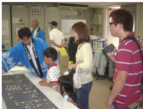
たくさんの市民の方々にご来場いただきました。