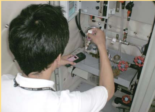
★蛇口における水道水の検査の様子です。

また、そのうち8箇所において、水道法で定められた項目（水質基準50項目）について、毎月定期検査を実施しています。