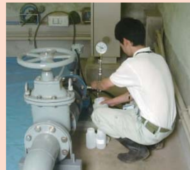
★取水井戸における地下水の検査の様子です。

地下水については、深さ200m程度の深井戸から取水しているため、水質は全般的に良好です。