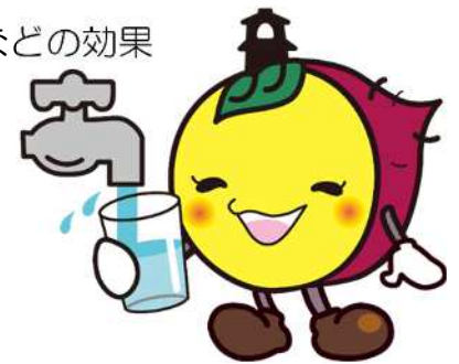
川越市マスコットキャラクター ときも

水安全計画の策定により、①安全性の向上②維持管理の向上③技術の継承④関係者の連携強化、などの効果が期待されます。