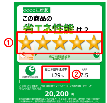
【統一省エネルギーラベル】

「省エネ型製品情報サイト」( https://seihinjyoho.go.jp/ )で確認することができます。