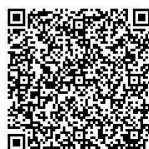
電子申請 QR コード