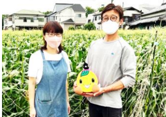
手間暇かけて育てたトウモロコシをぜひ味わってください