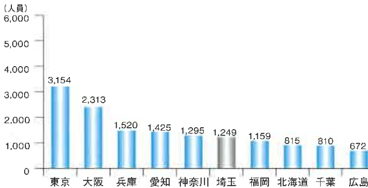
都道府県別検挙・補導人員(令和2年)