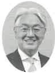
川越地区保護司会

の皆様方におかれましては、日頃から更生保護活動を通じ、犯罪のない明るい社会づくりにご尽力を賜り、心より御礼申し上げます。