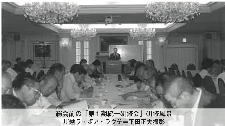
総会前の「第1期統一研修会」研修風景 川越ラ・ボア・ラクテ

結びに、川越地区保護司会の皆様方の益々のご健勝とご多幸をお祈りいたしまして、ご挨拶とさせていただきます。