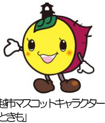
川越市マスコットキャラクター「ときも」