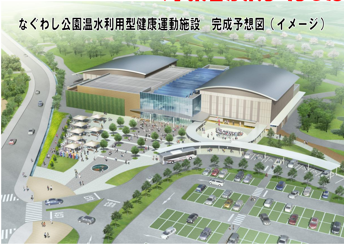
なぐわし公園温水利用型健康運動施設 完成予想図（イメージ）

市は、なぐわし公園の内、第一期事業（温水利用型健康運動施設等整備運営事業）をPFI事業として整備することとして各種手続きを行ってまいりましたが、ここで本事業を行う事業者が決定しました。今後、事業者により本施設の設計・建設を行い、平成二十四年七月に完成、同二十四年八月オープンを予定しています。