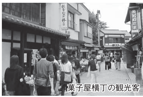
菓子屋横丁の観光客

問 基金の設置により観光振興を更に推進し、魅力あるまちづくりを進めるため、必要な金額として3千万円を積立金額とした。