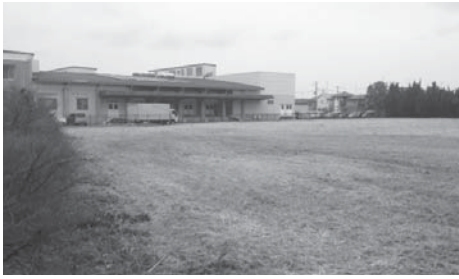
仮称新学校給食センター整備事業用地

議案第77号 仮称新学校給食センター整備事業用地の取得 【日本共産党】 圃公社が取得してから市圃周辺の状況など利用に としてどのような土地活 用を検討してきたのか。 圃平成15年に用地を南北 に分割し、北側を学校給 食センター建設用地とし て、南側を防災拠点施設 を含む消防本部等の用地 として活用する方針が決 定された。その後、防災 拠点施設を含む消防本部 等としての活用を見送っ た。また、市営住宅の建 て替え用地や、一般住宅 向けに売却するなどの活 用案を検討したが具体化 しなかった。