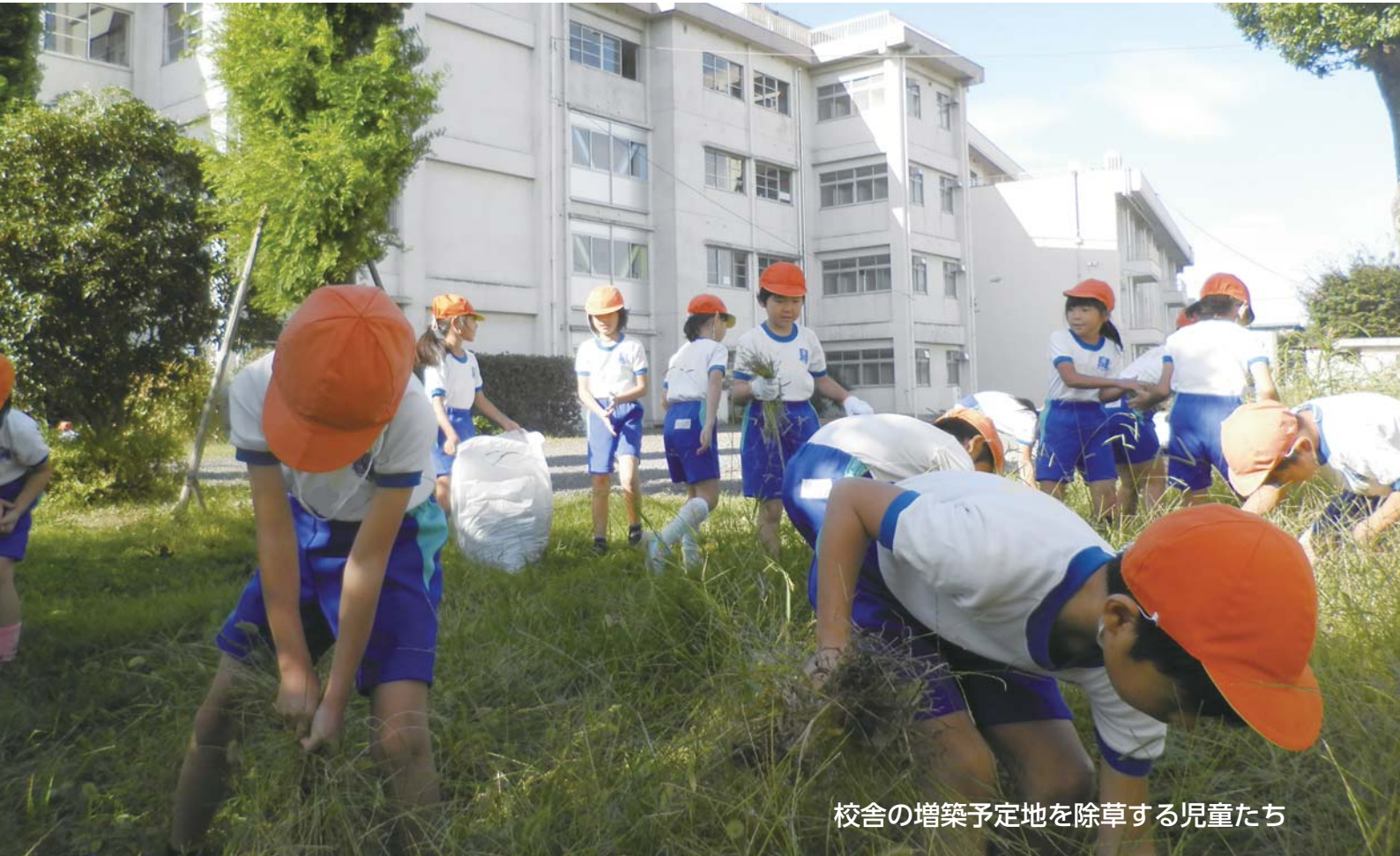
校舎の増築予定地を除草する児童たち