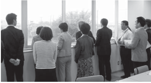
仮称新学校給食センター整備事業用地現地視察

議案第77号 仮称新学校給食センター整備事業用地の取得 【日本共産党】 圃公社が取得してから市圃周辺の状況など利用に としてどのような土地活 用を検討してきたのか。 圃平成15年に用地を南北 に分割し、北側を学校給 食センター建設用地とし て、南側を防災拠点施設 を含む消防本部等の用地 として活用する方針が決 定された。その後、防災 拠点施設を含む消防本部 等としての活用を見送っ た。また、市営住宅の建 て替え用地や、一般住宅 向けに売却するなどの活 用案を検討したが具体化 しなかった。