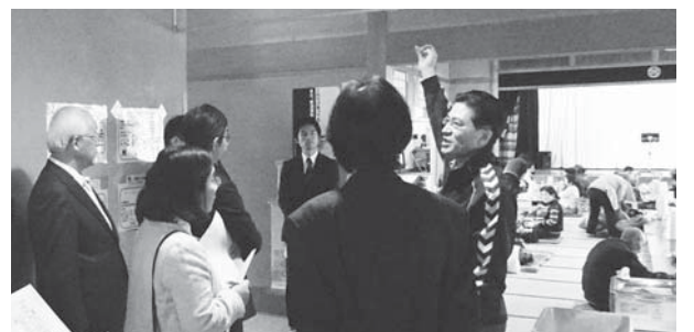
老人福祉センター西後楽会館現地視察