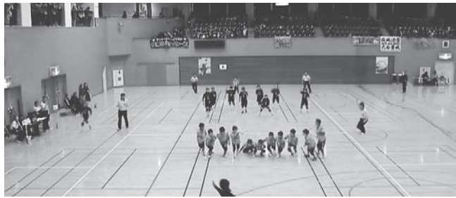
川越運動公園総合体育館での競技大会の様子

が目指す効果を実現できると考えたこと、更には、同公社と本施設の設置目的が合致していることによるものである。