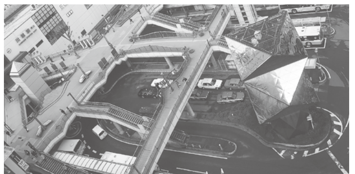
川越駅東口ペDESTリアンデッキと時世