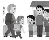
〔副〕住宅宿泊事業法

このようなことを踏まえ、一層の観光振興を図るため、安全で安心な生活環境を確保しながら、民泊を有効に活用する方策について今後検討していく。