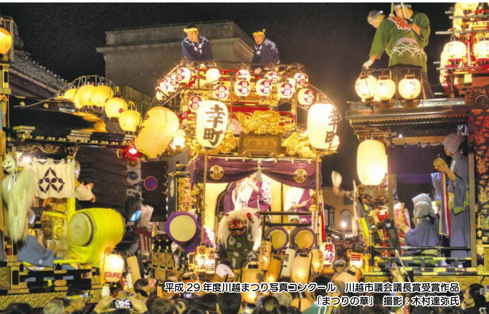
平成 29 年度川越まつり写真コンクール 川越市議会議長賞受賞作品 「まつりの華」