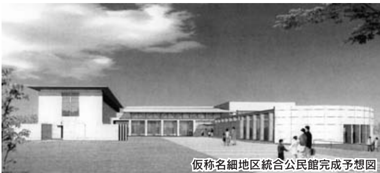
仮称名細地区統合公民館完成予想図