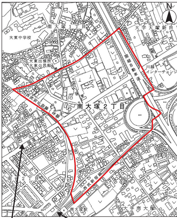
区域内の面積及び筆数の内訳（無地番の道路分を除く）