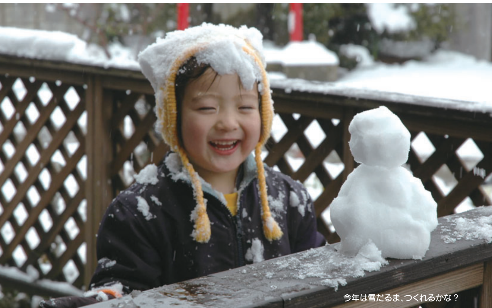
今年は雪だるま、つくれるかな？