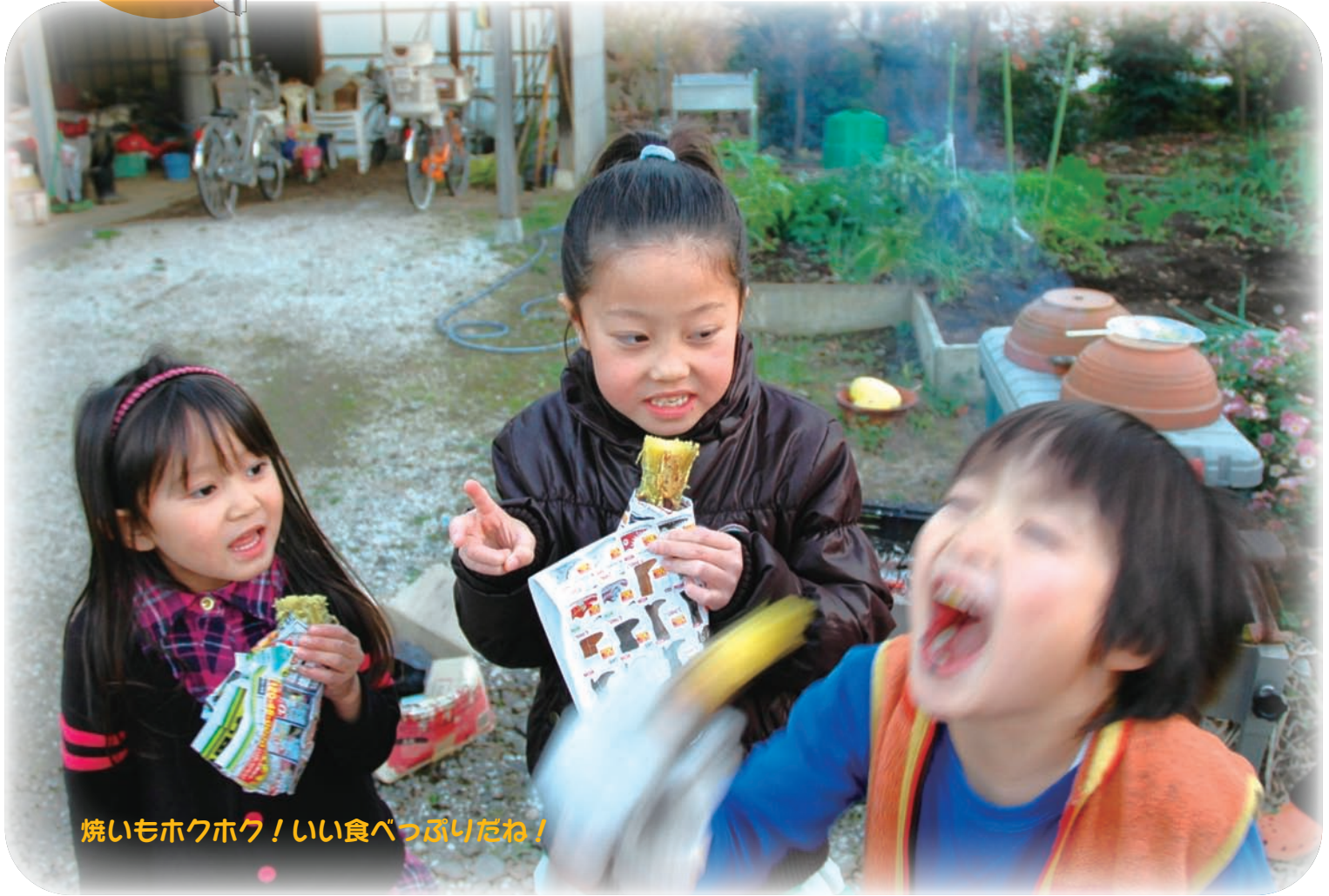
焼いもホクホク！いい食べっぷりだね！