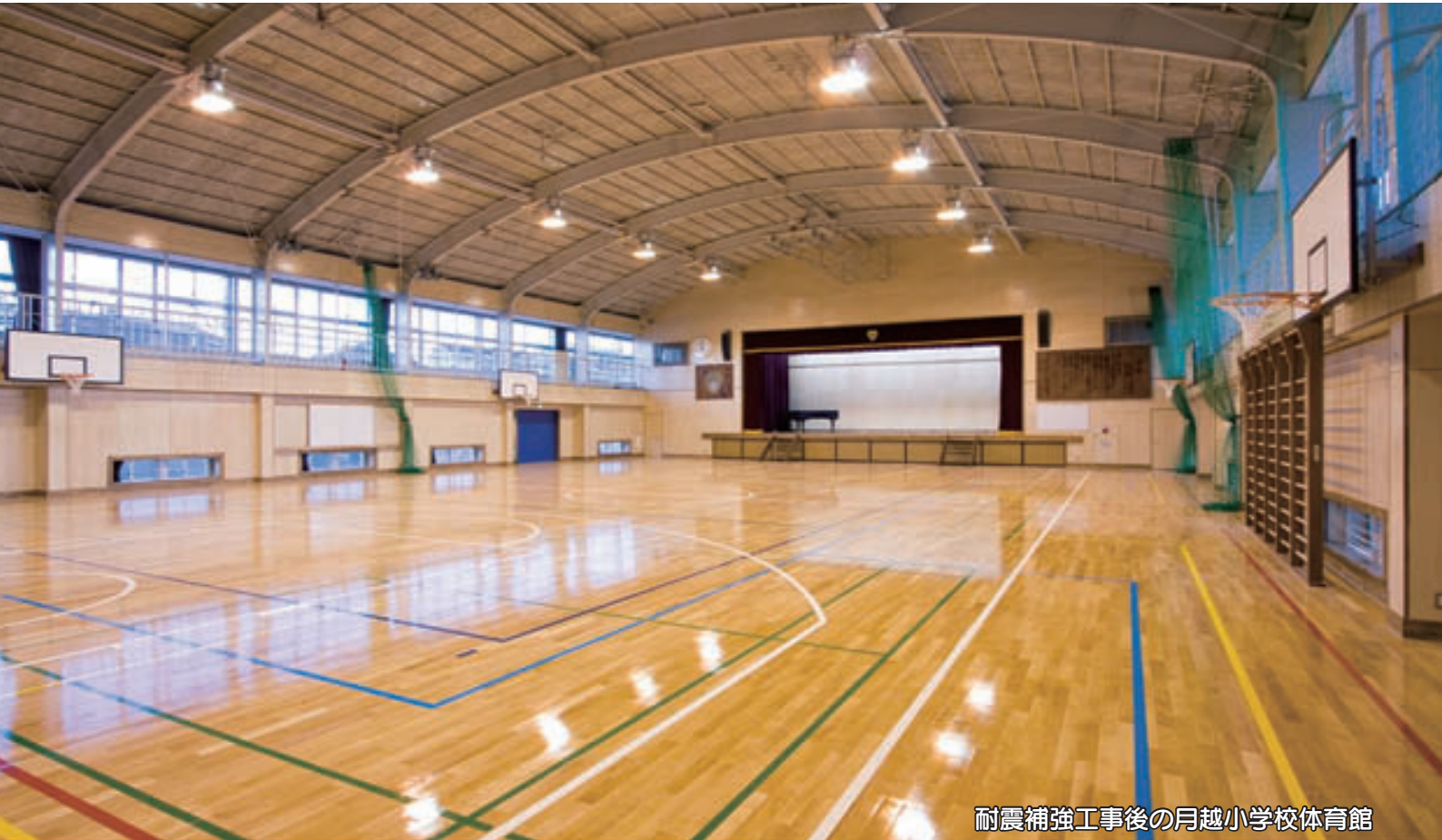
耐震補強工事後の月越小学校体育館