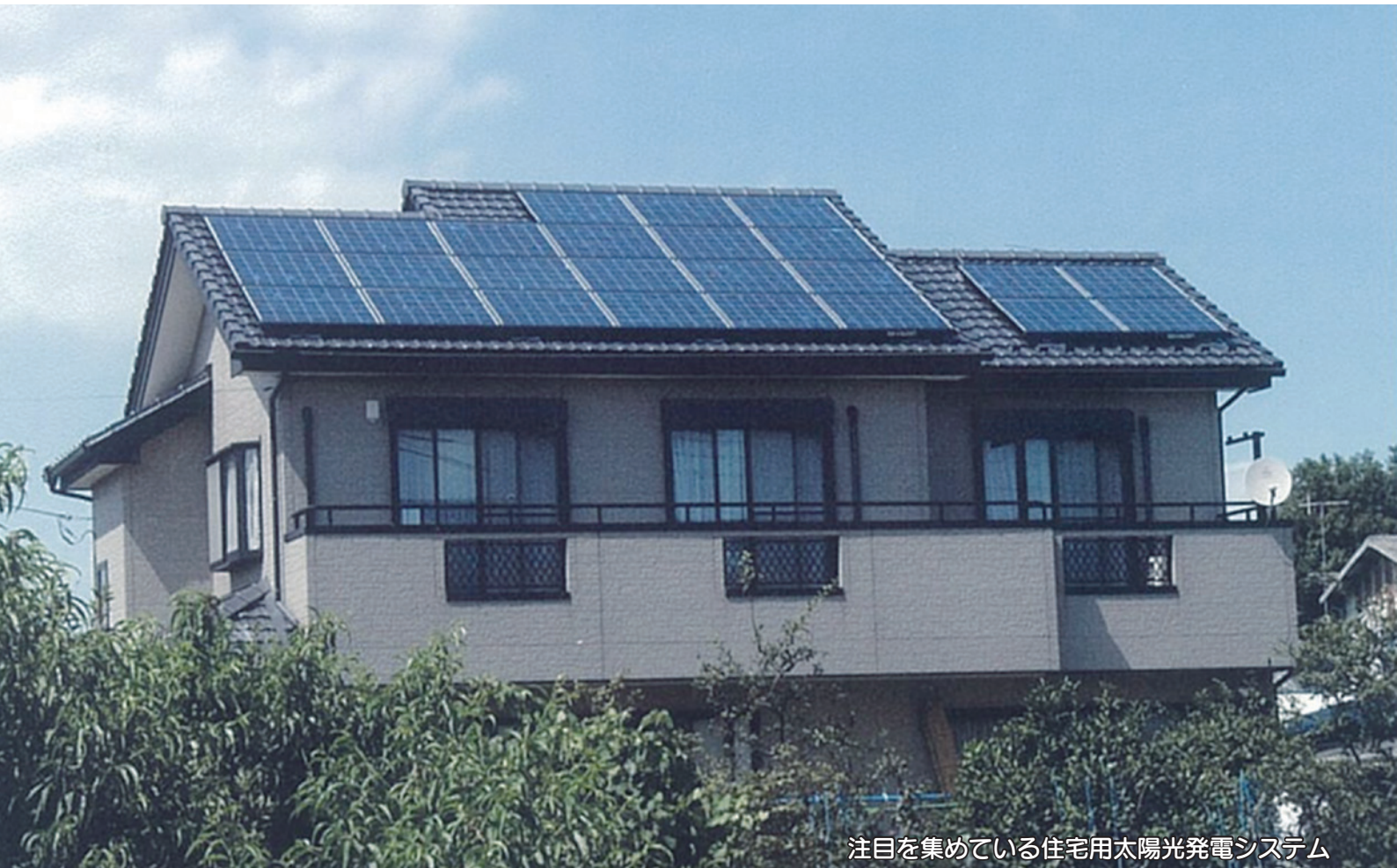
注目を集めている住宅用太陽光発電システム